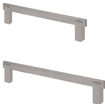
Möbelgriff Vertic 3 Griffprofil 15 x 6 mm, inkl. Schrauben M 4