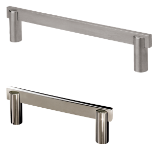
Möbelgriff Vertic 1 Griffprofil 15 x 6 mm, inkl. Schrauben M 4