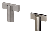
Möbelknopf Vertic 1 K inkl. Schraube M 4